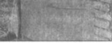
高祥付、付德庆、高祥付、付德庆、高祥付、付德庆...

广饶县土地资源丰富,大豆、小麦、水稻种植居全县主导地位,畜牧、水产养殖也随着荒碱地的开发迅速扩大规模,成为富民强县的重点,如何将农业由“大”变“强”?垦利县及时把招商引资的项目重点转移到农业产业化建设的轨道上来,以招商引资为渠道解决了在产业化建设中许多自身无力解决或势单力薄的问题。自1992年起,该县就与香港宝明地产有限公司合作,引进港资10万美元,建起了东营胜宝制革有限公司,该公司如今形成了年加工猪、牛、羊皮40万张,年创产值2500万元的生产能力,其“超雷”牌皮衣畅销全国各大中城市,被评为“中国市场名牌”。该县还引进胜利油由资金500万元建起了东营市顶力食品有限公司,进行大豆深加工项目。如今该厂已成为生产豆奶粉及大豆分离蛋白、浓缩蛋白、脱脂蛋白等系列产品,年创产值800余万元。该县共先后建起与外商及港台客商合资的农业龙头企业几家,市场连龙头,龙头带基地,基地连万家,较好地促进了农产品的转化增值,促进了县域经济的快速发展。